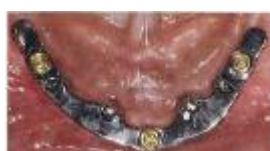
インプラント上に装着されたバー