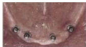
下あごにインプラントを埋入した口腔内

いままでは、それをクリニックで外し清掃しなければならなかったものが、ご自身で清掃が可能になりました。このシステムはCAD/CAMにより製作され、その精度、強度、使用感が、従来の鑄造法と比べ格段に向上したものです。