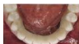
義歯が装着された口腔内

*「インプラント バー アタッチメント」はノーベルバイオケアジャパン * が2011年厚生労働省認可を得て発売しました。すでに、欧米では多くの症例が報告され、今年のIDS * (インターナショナルデンタルショー)でも、多くの歯科メーカーから同様なシステムが発表されています。ノーベルバイオケアジャパンのアタッチメントは、他社に先駆けた日本初のシステムです。