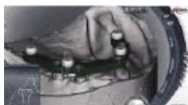
CADによるインプラントバーの設計